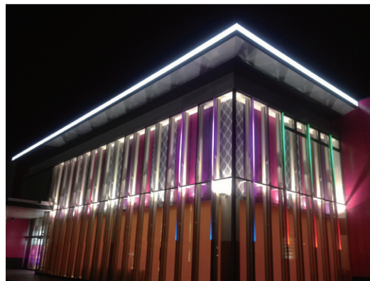
● アミューズメント施設 壁面ライン照明 リオウェーブ RGB DC12V